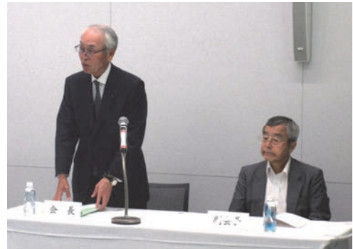
金森会長あいさつ